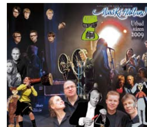
Utbudskatalog för Barn och ungdom 2009